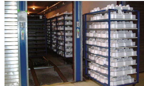
Horno de secado

Los moldes son compatibles en todos nuestros centros de producción de la división Molding. De este modo, la producción puede ser transferida de forma rápida y sencilla a todos nuestros emplazamientos.