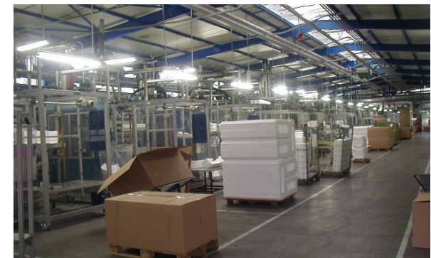
Planta de producción