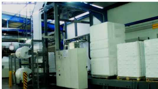
Maquina de embalaje completamente automática