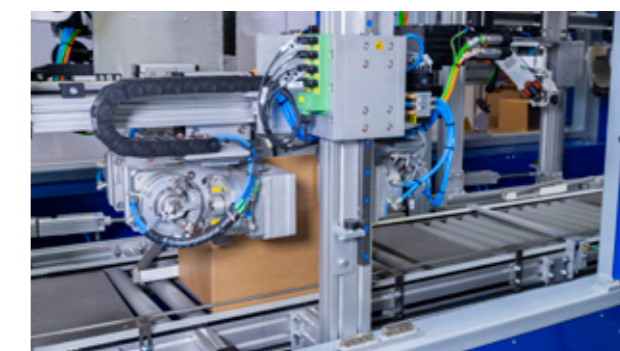
3. PLEGADO DE SOLAPAS DE TAPA