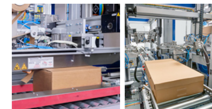
4. SELLADO CON CINTA DE PAPEL AUTOADHESIVO/ENGOMADO O ALTERNATIVA CON TAPA