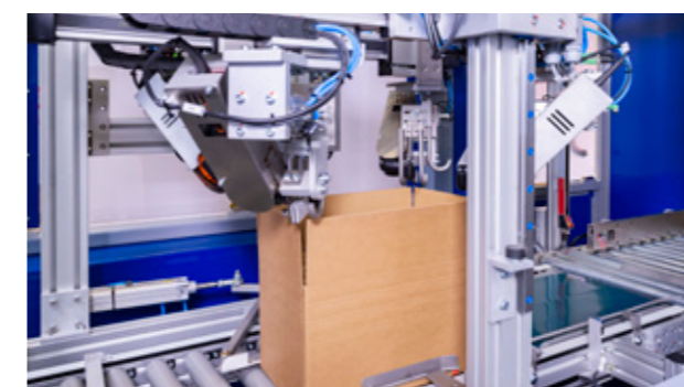
2. CORTE DE ESQUINAS DE CAJAS